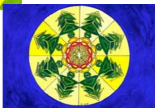
Motiv 3 „Weihnachtsmandala“

Bestellungen sind mit Angabe des Motivs, der Anzahl sowie des Namens und der Adresse möglich: info@bunterkreis-aachen.de oder telefonisch 0241/89 46 44 00