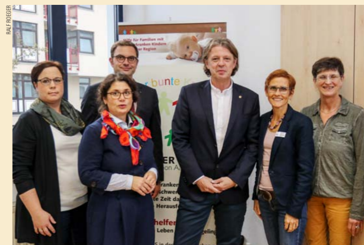
Großartige Unterstützung für das Diabetesprojekt

Bereits zum 2. Mal hat das Lions Club Aachen Kaiserpfalz Hilfswerk e.V. das Diabetes-Projekt „Alles klar!“ unkomplizierte Hilfe für an Diabetes erkrankte Kinder und deren Familien, großzügig mit 2.500 Euro unterstützt. Die internationale Lions-Organisation hat seit diesem Jahr das Thema Diabetes als weiteren Schwerpunkt ihrer sozialen und caritativen Tätigkeit beschlossen.