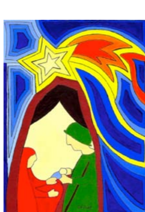
Motiv 1 „Weihnachten 2018 I“

Der BUNTE KREIS in Zusammenarbeit mit der Aachener Künstlerin Sabine Reimann bietet wieder handgefertigte Weihnachtskarten an. Preis: 1,80 Euro/Stk. Bei Abnahme von 5 Karten: 1,50 Euro/Stk. 50% des Kaufpreises gehen an den BUNTEN KREIS.