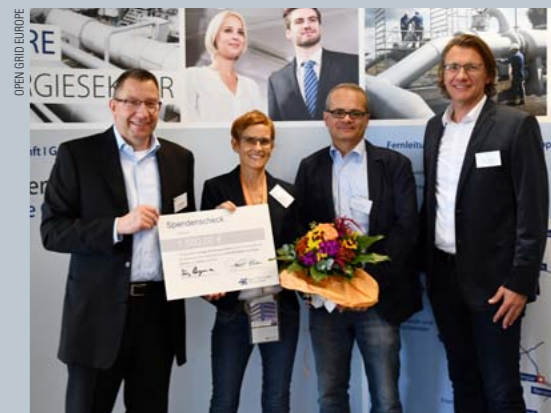
Tolles Engagement von Open Grid Europe

Gesellschaftliche Verantwortung hat für Open Grid Europe einen hohen Stellenwert. Eine Initiative in diesem Zusammenhang ist die Rest-Cent-Aktion. Im Zuge dieser Aktion ha-