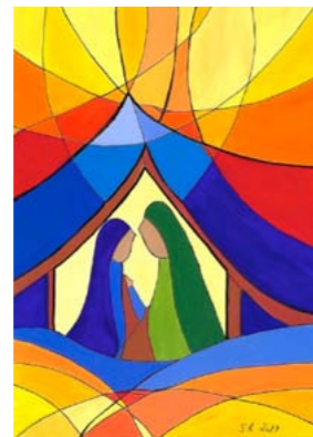
Motiv 1 „Krippe mit Licht“

Preis: 1,80 Euro/ St. · Bei Abnahme von 5 Karten: 1,50 Euro/ St. 50% des Kaufpreises gehen an den BUNTEN KREIS.