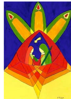
Motiv 3 „Krippe mit Kerzen“

Bestellungen sind mit Angabe des Motivs, der Anzahl sowie des Namens und der Adresse möglich: