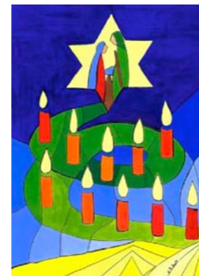
Motiv 2 „Weihnachtskranz mit Krippe“