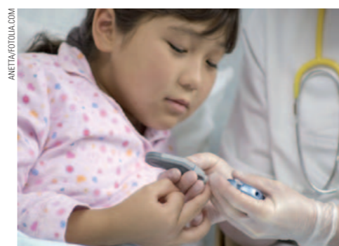
Unbürokratische Hilfe für Kinder mit Diabetes

Wenn bei einem Kind die Diagnose „Diabetes mellitus“ gestellt wird oder mit Eintritt der Pubertät sich neue Probleme beim Umgang mit dem Diabetes auftun, bedeutet dies in der Regel für die gesamte Familie eine erhebliche Änderung des täglichen Lebens. Obwohl Eltern und Kinder im Kran-