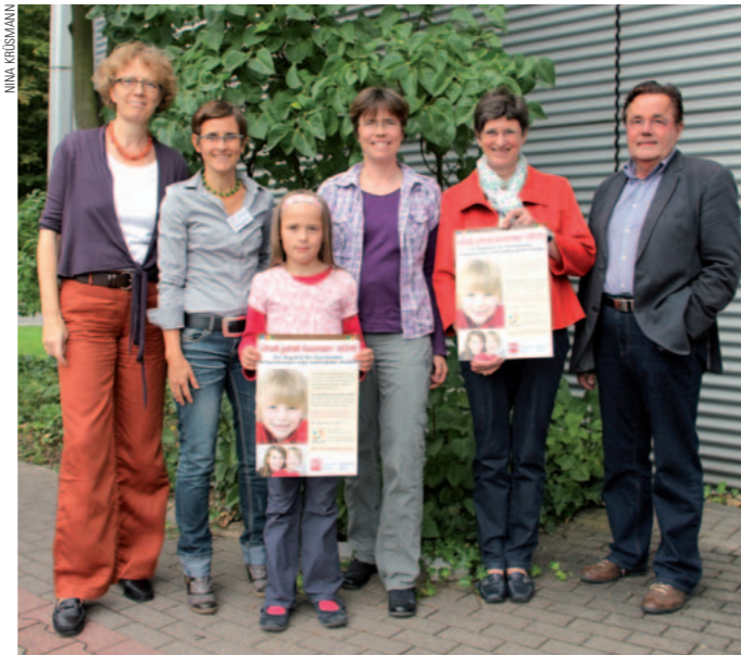
Der BUNTE KREIS freut sich sehr über den Förderpreis der Initiative FamilienBande

Workshops wahrnehmen, in denen der BUNTE KREIS bei Bedarf zu anderen regionalen Angeboten vernetzt.